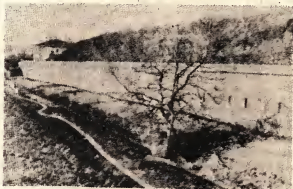
Крепость - Косой Капнар.